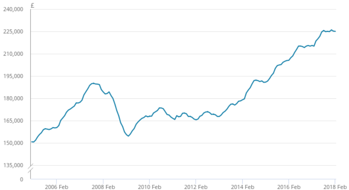
Figure 2: Average UK house price, January 2005 to February 2018